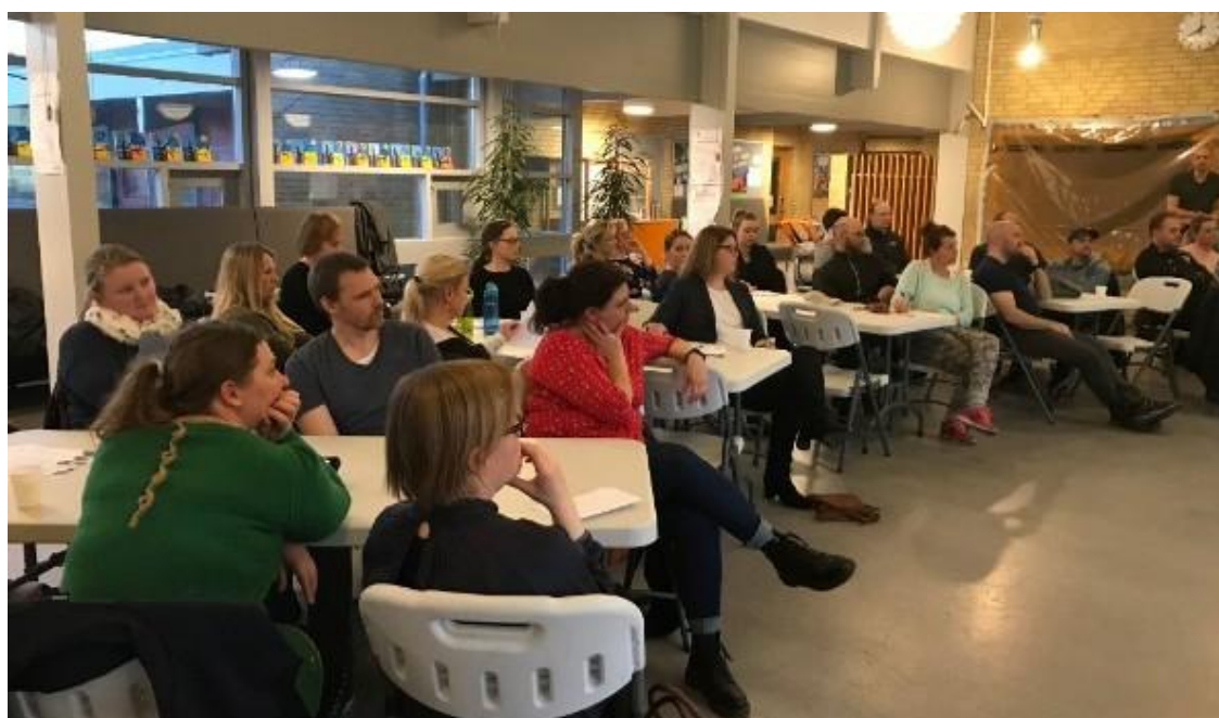
Forældrestormøde 2018 havde forældrenes rolle for børnenes trivsel på dagsordenen

Derfor bliver skolestart 2018 historisk! Vi kommer til at kunne byde den første 8. klasse nogensinde på Vindinge Skole velkommen! Det er en fantastisk følelse. Bestyrelsen er spændt, eleverne er spændte, forældrene er spændte. De to kommende år bliver enestående, og vi har i bestyrelsen været med til at sikre, at der er afsat midler nok til at skabe en udskoling i topklasse.