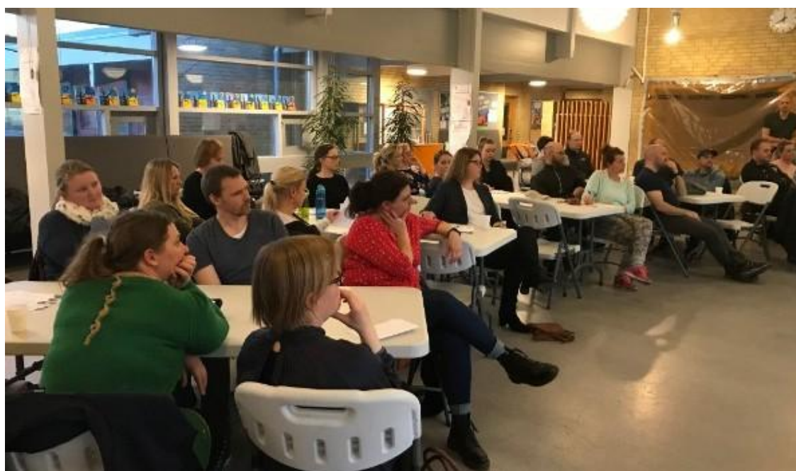
Forældrestormøde 2018 havde forældrenes rolle for børnenes trivsel på dagsordenen

Derfor bliver skolestart 2018 historisk! Vi kommer til at kunne byde den første 8. klasse nogensinde på Vindinge Skole velkommen! Det er en fantastisk følelse. Bestyrelsen er spændt, eleverne er spændte, forældrene er spændte. De to kommende år bliver enestående, og vi har i bestyrelsen været med til at sikre, at der er afsat midler nok til at skabe en udskoling i topklasse.